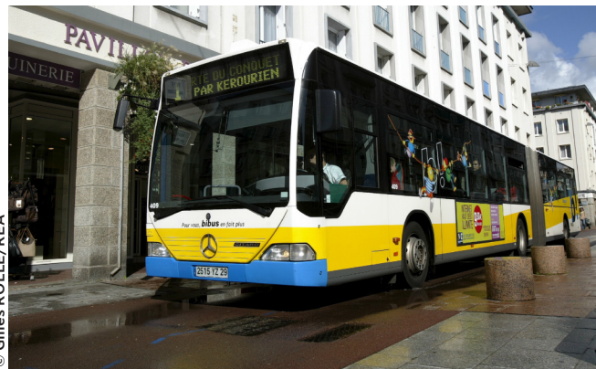
Les bus de la métropole brestoise sont désormais aménagés de telle sorte à correctement protéger leur conducteur.