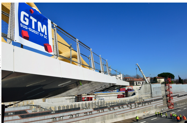
Certains ouvriers de GTM Bâtiment Aquitaine ont déjà repris le travail, mais sur la base du volontariat.

remporté 97% des voix aux dernières élections. « Nous n'avons pas rencontré de difficultés avec les encadrants qui étaient pour la plupart d'accord avec cette décision », précise le délégué syndical. Une fois les chantiers à l'arrêt, un flou subsiste quelque temps sur la situation des salariés. Les directives ne sont pas claires en ce début de confinement. Le gouvernement considère que le BTP doit continuer de tourner. Les dossiers d'activité partielle des entreprises du BTP sont refusés par les Direccte. À cela s'ajoutent les déclarations de la ministre du Travail qui qualifie de « défaitistes » les entreprises